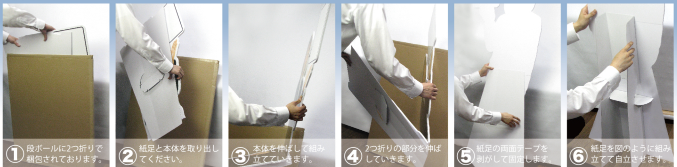
1 段ボールに2つ折りで梱包されております。 2 紙足と本体を取り出してください。 3 本体を伸ばして組み立てていきます。 4 2つ折りの部分を伸ばしてしていきます。 5 紙足の両面テープを剥がして固定します。 6 紙足を図のように組み立てて自立させます。