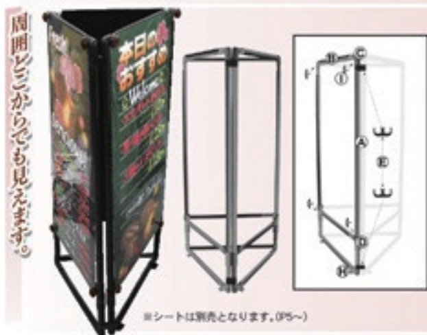
※シートは別売となります。(P5~)

ジョイントバックカーE(P16)を使用し、周囲を囲んでしまう設置方法です。筒型に連結していくので、四角形、五角形と多連結が可能になります。