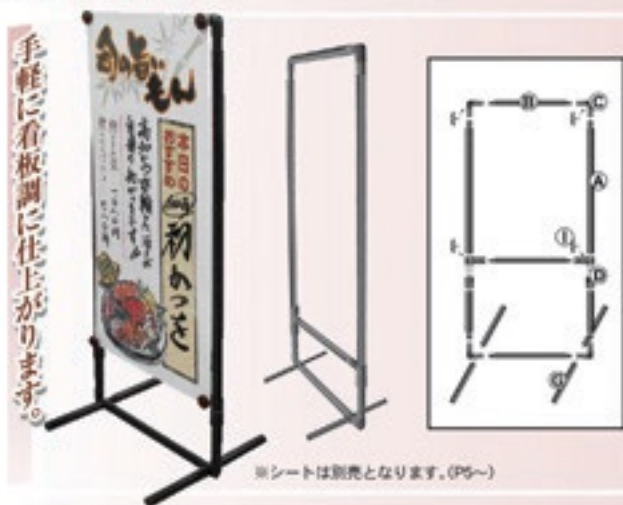
※シートは別売となります。(P5~)

看板調に使用できます。スタンディングポールG(P16)との組み合わせで、自立が可能となり、両面使用することができるようになります。